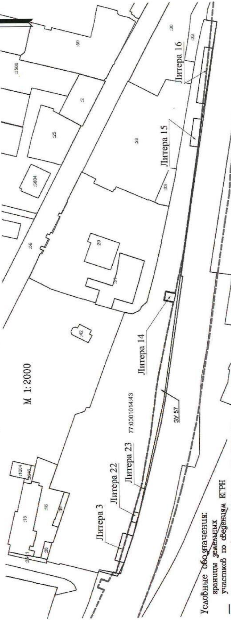
Схема расположения объектов недвижимости ОАО "Московский механический завод "Красный путь" в границах зоны планируемого размещения объекта «Реконструкция участка Москва-Пассажирская-Курская (вкл.) - Москва-Товарная-Курская - Карачарово (искл.)» со строительством дополнительных главных путей»